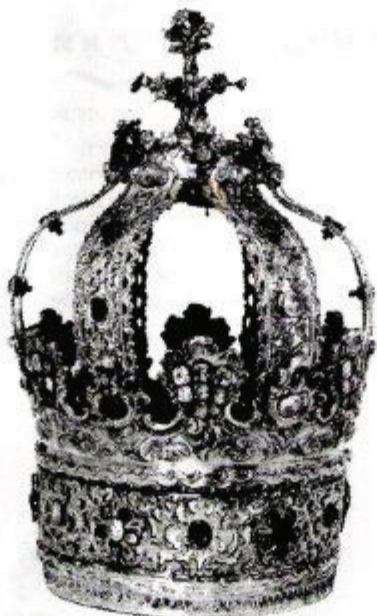
כתר תורה, כסף משופץ יהלומים ואבני-חן, פולין, המאה ה-19

– 'נולדתי' בתנות תכשיטים. להורי הייתה תנות תכשיטים ידועה ומפורסמת בתל-אביב של ימי ראשית המדינה. בסמוך לה היה